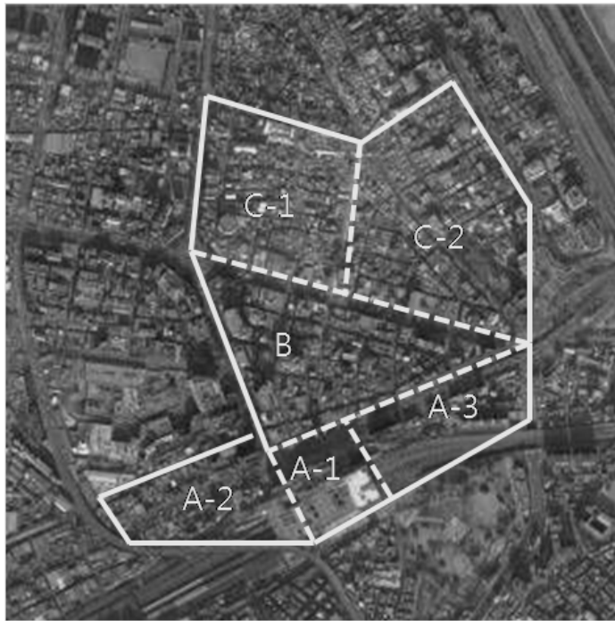
[그림 1] 영등포역 조사지역 개요

영등포 지역 조사는 크게 3개의 지역에서 이루어졌다. 영등포역과 롯데백화점이 있는 지역(편의상 A지역), 영등포 롯데백화점 맞은편의 오른쪽 지역(편의상 B지역), 영등포 시장이 있는 지역(편의상 C지역)을 조사대상지로 선정하였다.