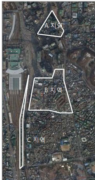
[그림 2] 서울역 조사지역 개요

서울역 인근은 크게 세 지역에 대해 조사가 이루어졌다(편의상 A, B, C지역).