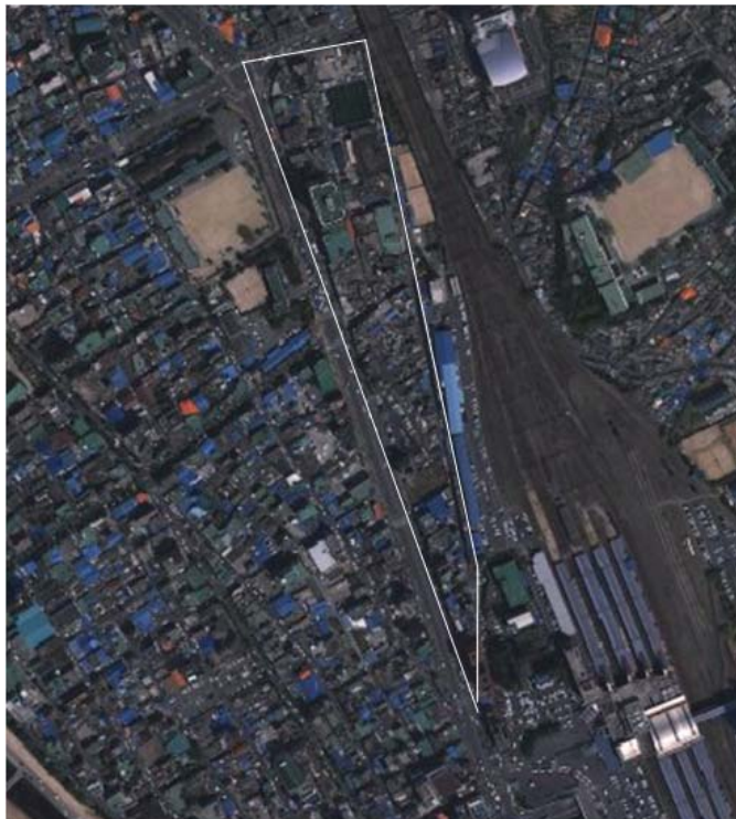
[그림 3] 대전역 조사지역 개요