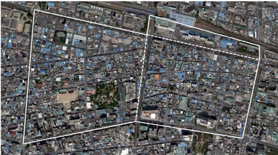
[그림 4] 대구역 조사지역 개요

대구지역은 공동조사자의 자문을 구해 대구역 부근으로 조사대상지를 결정하였다. 추천된 곳은 여러 곳이었는데, 대구지역의 특징으로 쪽방이나 빈곤지역 밀집지역이 작은 규모로 산재되어 있어서 가장 규모가 클 것으로 예상되는 대구역 인근을 조사하였다. 조사대상지역은 크게 A, B, C 지역으로 구분될 수 있다.